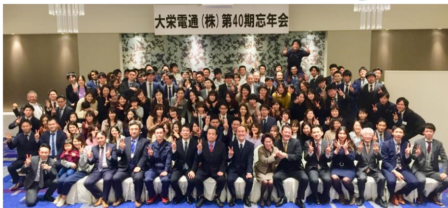
大栄電通(株)第40期忘年会

2019年もより一層お客様に満足していただけるサービスを提供できるよう、全社員一丸となつて一生懸命頑張つてまいりますので、今後とも弊社をよろしくお願致します。